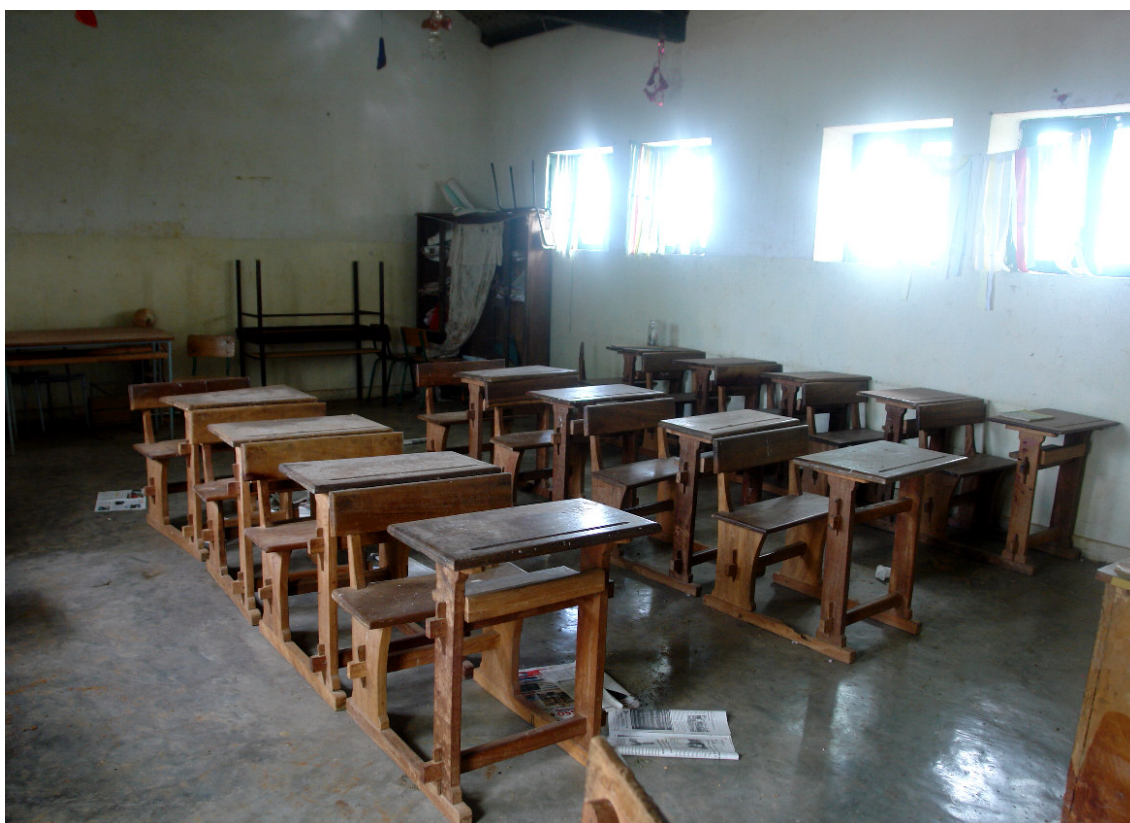
Sala de aula

A Baía possui uma EBI com 03 salas de aula e 125 alunos (ano lectivo 2006/2007) e um Jardim infantil com 24 crianças.