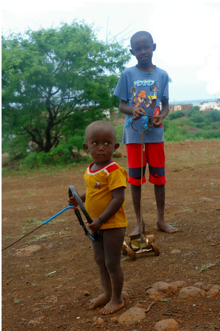
Brinquedos dos meninos