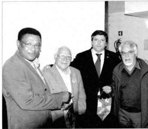
Rotary vai exhibir vídeo sobre Cabo Verde

Uma das principais acções será a exibição de "Video-Postais de Cabo Verde", seguida de palestra, no dia 23 pelas 21h30, no Auditório da Bi-