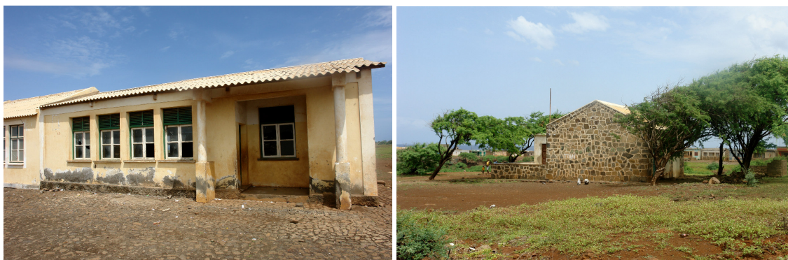
Estabelecimentos de ensino da Baía (fotos RCMP)

A Baía possui uma EBI com 03 salas de aula e 125 alunos (ano lectivo 2006/2007) e um Jardim infantil com 24 crianças.