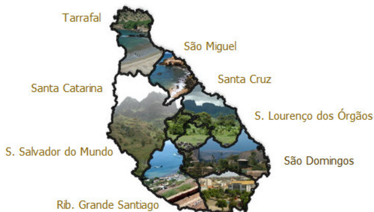
Concelhos da Ilha de Santiago

O Concelho de São Domingos foi criado pela Lei no 96/IV/93 de 13 de Dezembro, abrangendo as freguesias de São Nicolau Tolentino e Nossa Senhora da Luz na Ilha de Santiago.